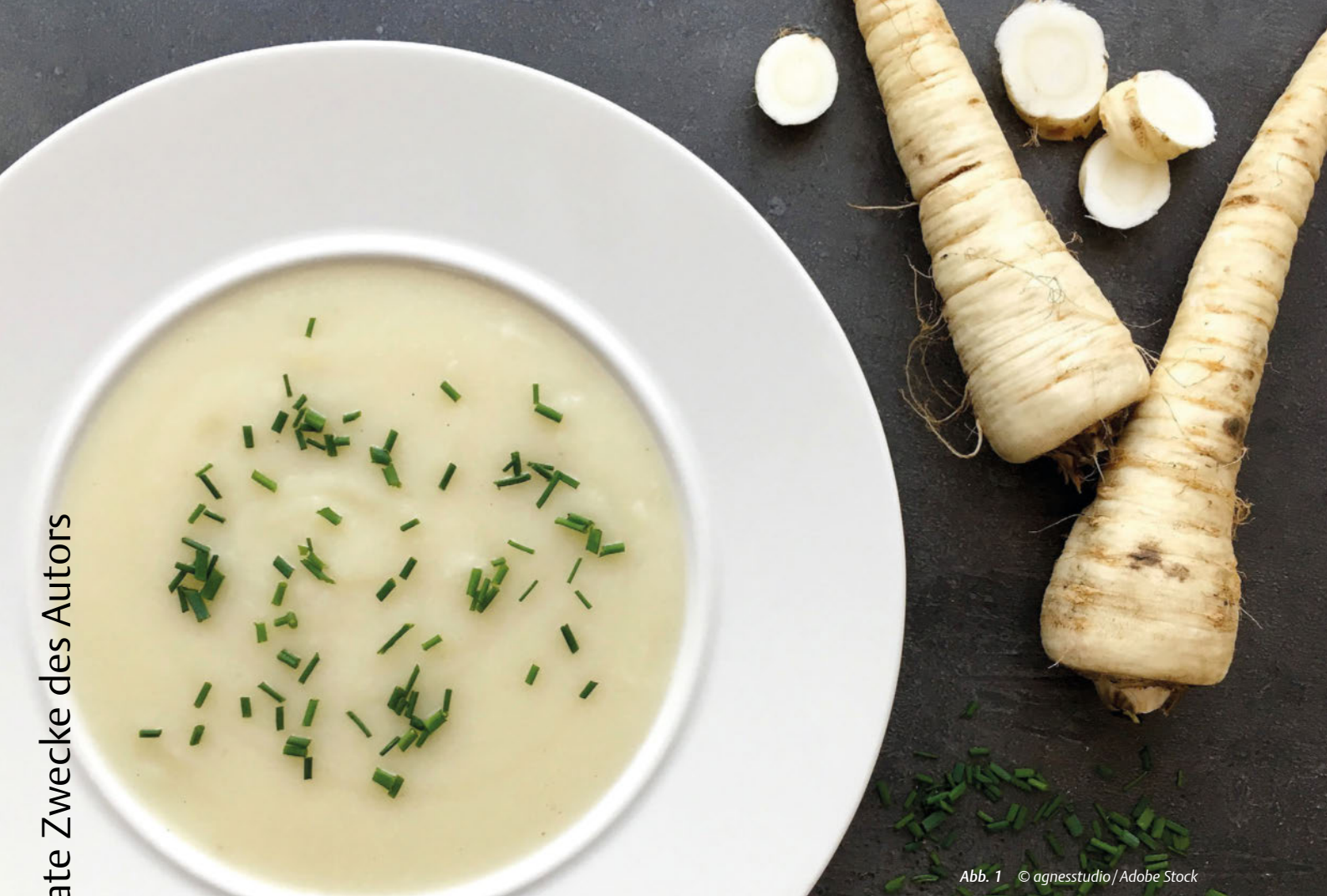
Abb. 1